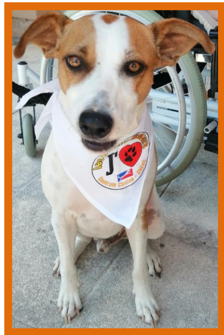
Visite de RAVEN, notre super toutou