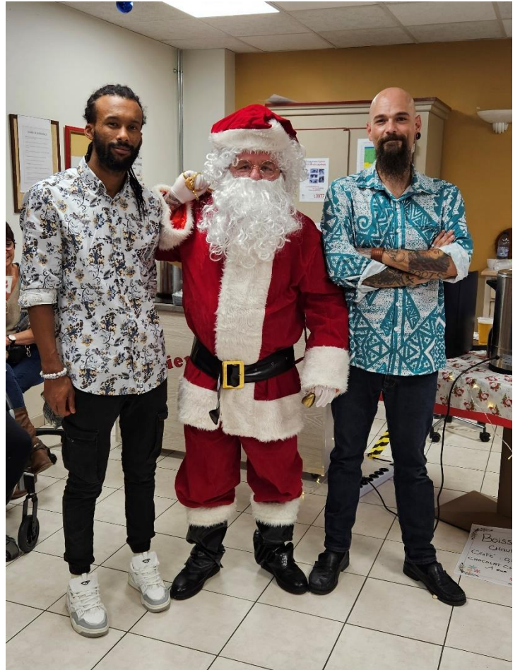
Et encore des sourires...